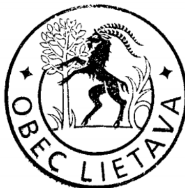
PEČAŤ OBCE LIETAVA